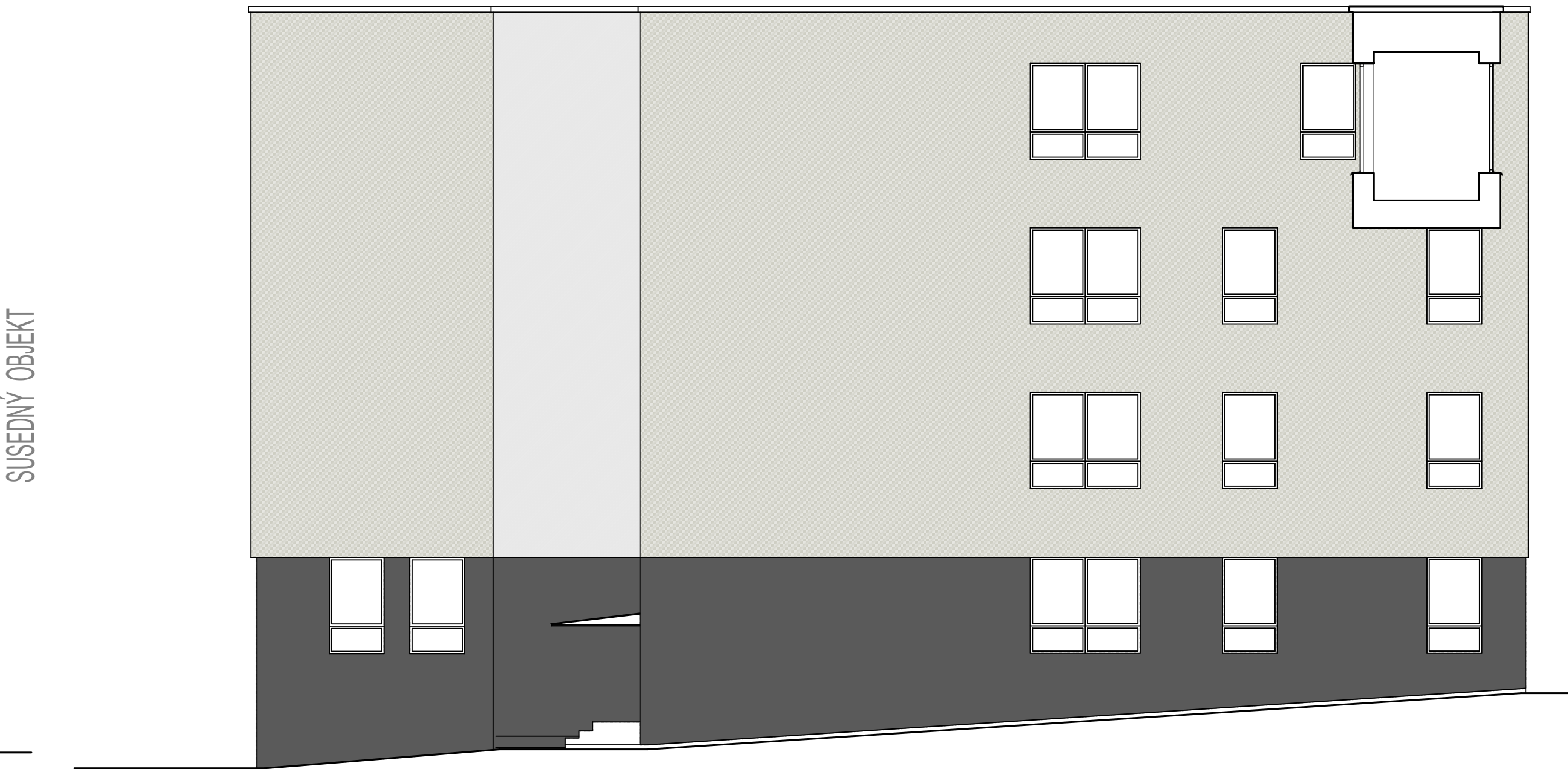
POHLAD BOČNÝ, VÝCHODNÝ