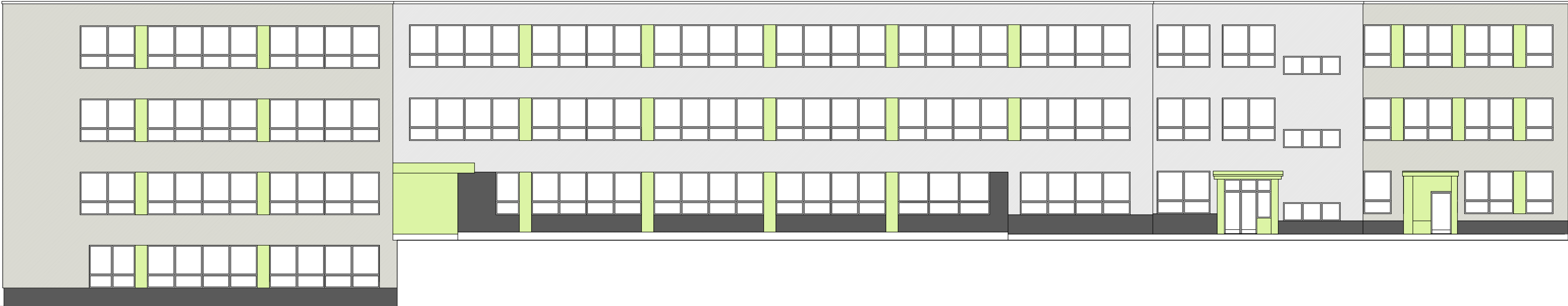
POHLAD ZO SOKOLSKÉJ